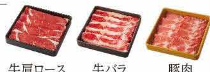
牛肩ロース 牛バラ 豚肉