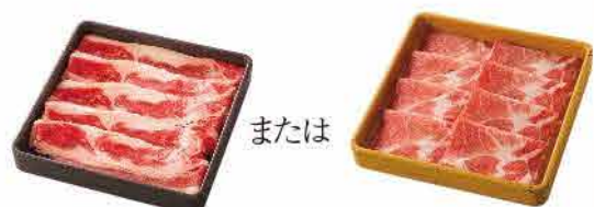
牛バラ 1皿 または 豚肉 1皿