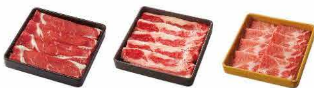
牛肩ロース 牛バラ 豚肉